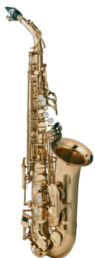
Mundstück mit einfachem Rohrblatt